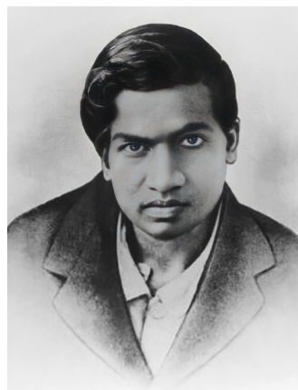
Srinivasa Ramanujan Aiyangar

Na poziv matematičara G. H. Hardyja 1914. Ramanujan dolazi na Sveučilište u Cambridgeu. Vrijeme provedeno u Engleskoj smatra se njegovim najproduktivnijim razdobljem. Ipak se zbog lošeg zdravlja 1919. vraća u Indiju, gdje umire godinu kasnije u dobi od samo 32 godine. Čak 56 godina nakon njegove smrti, na Trinity Collegeu u Cambridgeu, otkrivena je Ramanujanova Izgubljena bilježnica , skup papira koji sadrži matematičke rezultate iz posljednje godine njegova života. Važnost toga otkrića najbolje opisuju riječi američkog matematičara Brucea Berndta: „Otkriće ove Izgubljene bilježnice izazvalo je otprilike onoliko komešanja u matematičkom svijetu koliko bi otkriće Beethovenove desete simfonije izazvalo u glazbenom svijetu” [3].